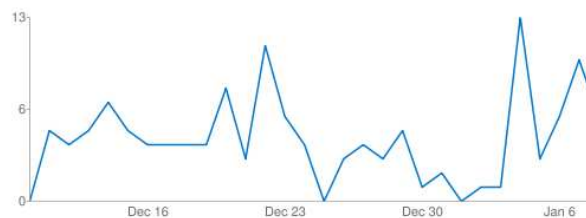
Figura 2: Estadísticas de Twitter de @ACAmbientales