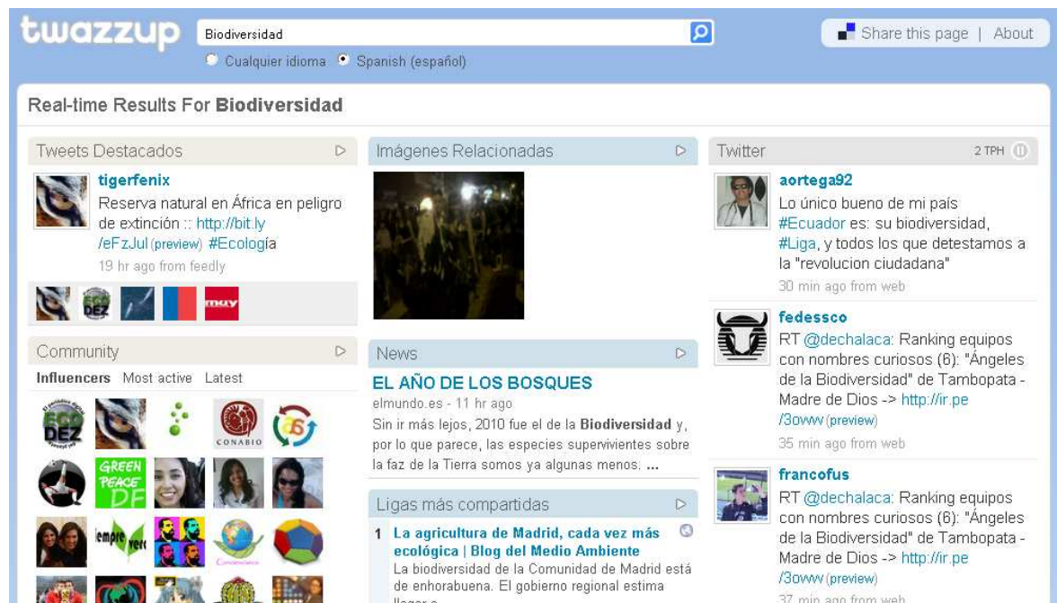
Figura 3: Últimas aportaciones sobre Biodiversidad en Twitter. Esta herramienta te permite ver las últimas páginas y fotos enlazados sobre el tema elegido, usuarios que más han comentado, "tweets" más destacados, etc