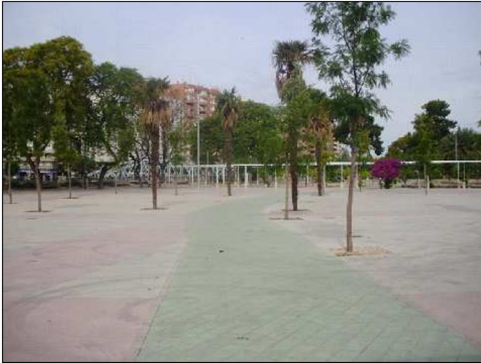
Figura 3.- Foto: Jardín Chino.

Dejando los Parques de Distrito, otras de las zonas que también destacan son las zonas nombradas como zonas verdes, según el PGOUM: son los espacios libres públicos más abundantes, generalmente inferiores a 12.000 m 2 de superficie, enclavados en áreas de uso dominante residencial, industrial o de servicios, destinados al disfrute de la población y con un alto grado de ajardinamiento y mobiliario urbano. Están básicamente destinadas a resolver las necesidades primarias de estancia y esparcimiento al aire libre de la población residente en un entorno próximo o frecuentemente usuaria del mismo.