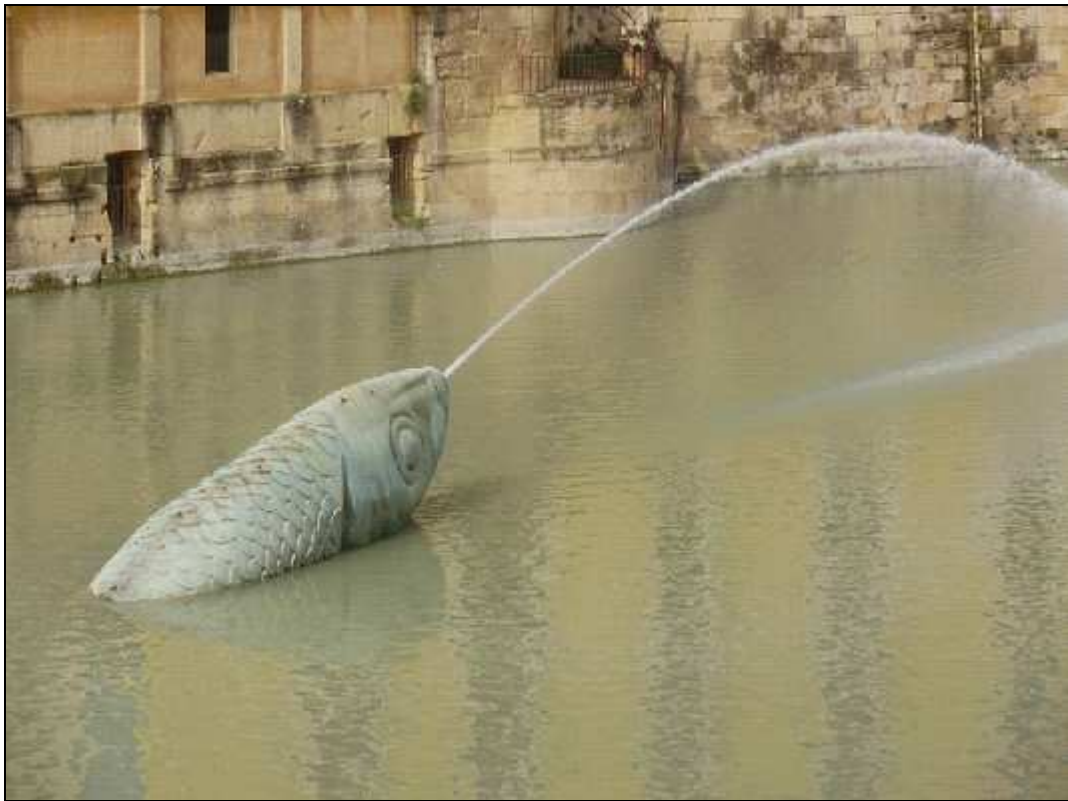
Figura 7.- Foto: Imagen de la Sardina Encallada.

Y además de todo esto, la práctica política mediante pancartas produciendo contaminación visual como podemos ver en esta figura: