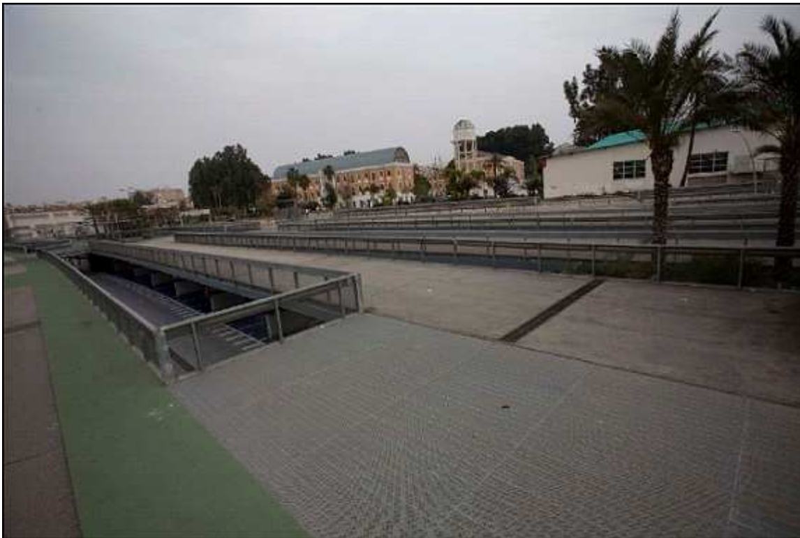
Figura 2.- Foto: Aparcamiento Cuartel de Artillería. Fuente: elaboración propia.

La descripción de esta unidad pone de manifiesto la falta de zonas verdes y paseos arbolados que justifica entre otras cosas lo que es un parque de distrito. Por lo que el uso del suelo no se adapta a lo que recoge el plan: no existen zonas verdes y por el contrario hay situado un aparcamiento.