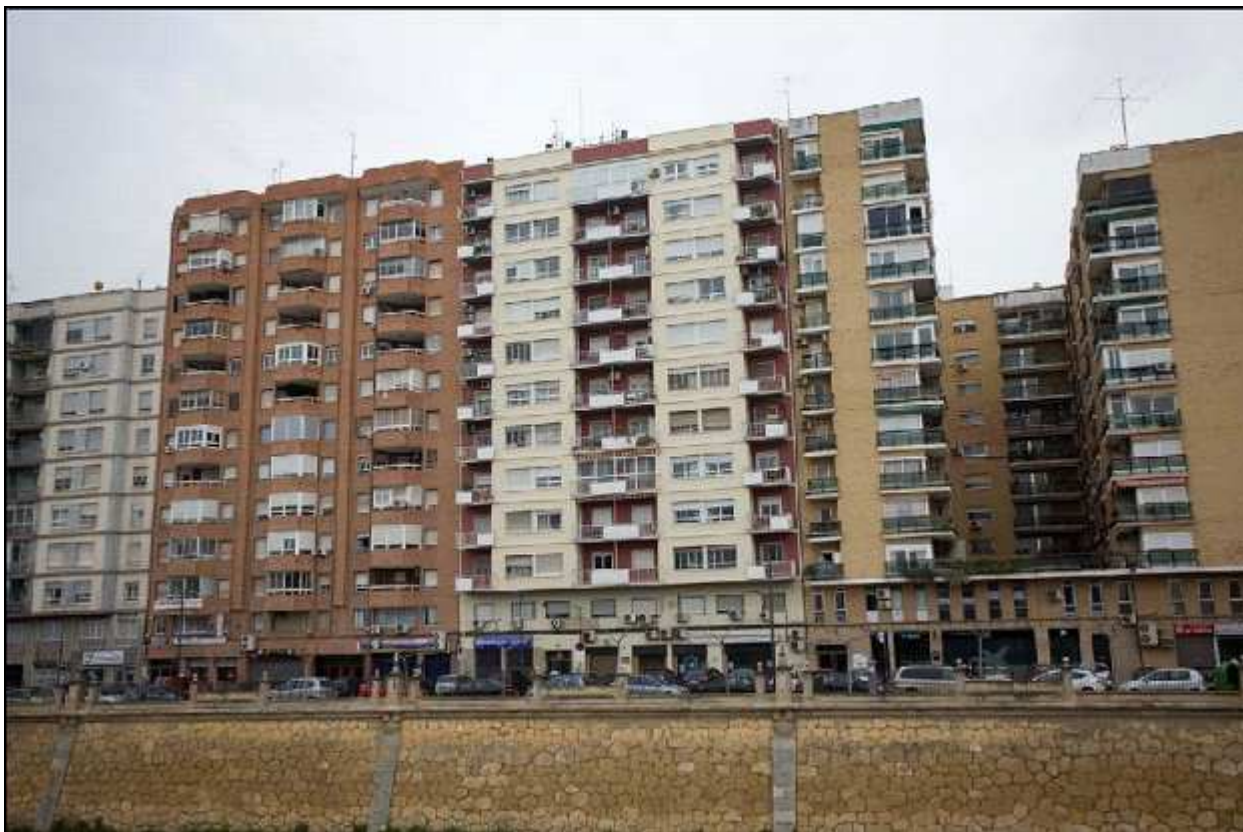
Figura 9.- Foto: Manzana cerrada tradicional.

Otra clase de uso de suelo son los Parques Metropolitanos Equipados, según lo recogido en la norma del PGOUM 2005, las zonas verdes se dividen en zonas verdes propiamente dichas, parques de distrito, las cuales ya hemos visto antes, y por último otro tipo que aún no hemos comentado, que son los parques metropolitanos, y que pueden ser de dos clases, equipados o recreativos. Según el PGOUM, define parque metropolitano como: <grandes parques predominantemente arbolados, estratégicamente localizados y articulados en relación a las tramas urbanas y a las áreas densas del hábitat diseminado, con superficies de más de 80.000 m 2 . En general están apoyados sobre elementos naturales y culturales particularmente relevantes para el mantenimiento y valorización de la identidad ambiental, cultural y urbanística local. Conforman el umbral superior de la oferta de zonas verdes de carácter urbano y periurbano> . Más concretamente los parques metropolitanos equipados son: < por sus características y relación con la trama urbana, son aquellos apropiado para una mayor implantación de