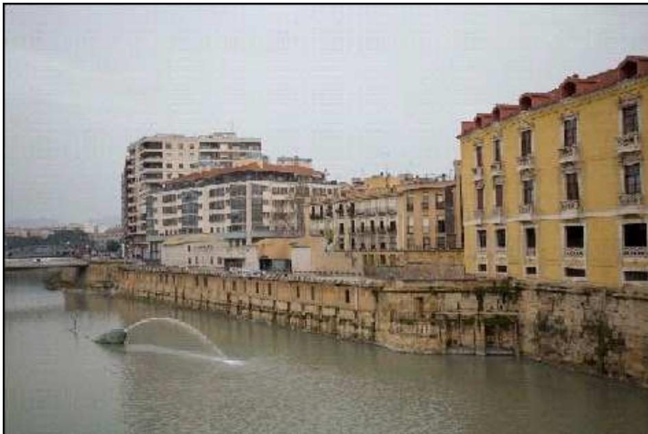
Figura 6.- Foto: Fondo escénico Museo Hidráulico Molinos del Río.

Además, como hemos observado en las imágenes hay un elemento que destaca y es el homenaje que se le hace a la Fiesta del Entierro de la Sardina ( más detalladamente en la figura 7 ) mediante una sardina en el cauce del río, a lo que nos tendríamos que preguntar ¿que hace una sardina en un río?, seguramente para esto habrá opiniones diversas y de todos los gustos. Si que se puede decir que se gana en espectadores, pero hay que pensar que series de actuaciones se pueden llevar a cabo en un río como el nuestro y cuáles no. La novedad de poner un elemento de estas dimensiones en un río no tiene porque pasar por alto que figura debemos de situar.