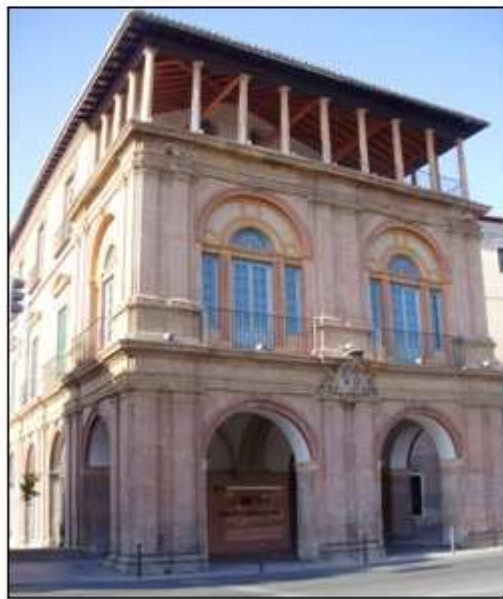
Figura 12.- Foto: Fachada Palacio de Almudí (imagen superior) y fachada de un extremo del Palacio Episcopal (imagen inferior).