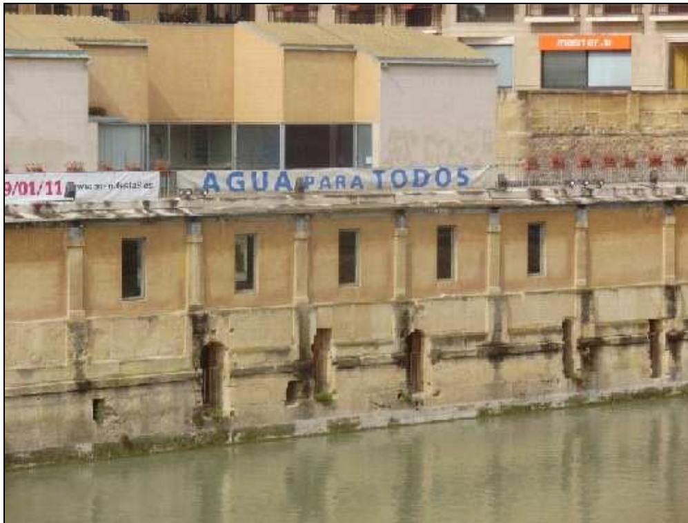
Figura 8.- Foto: Vista lateral edificio del Torreón.

En la unidad 4 de la margen derecha, también encontramos un conjunto de bloques residenciales que a pesar de que los edificios muestran características homogéneas, no es una buena fachada para esta zona de la ciudad ya que produce pérdida de calidad visual. Si nos fijamos en los balcones de la figura 9 cada uno es distinto, hay unos que presentan ventanas, otros no, y otros que lo que tienen son persianas, además de la presencia en mucho de ellos de aparatos de aire acondicionado que afean la fachada.