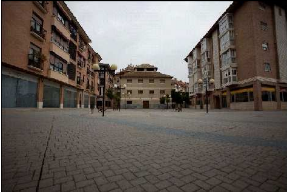
Figura 4.- Foto: Zona Verde de la Ud. 2D según el PGOUM .

es el arbolado según el PGOUM, es completamente nula de vegetación como podemos observar en la siguiente figura: