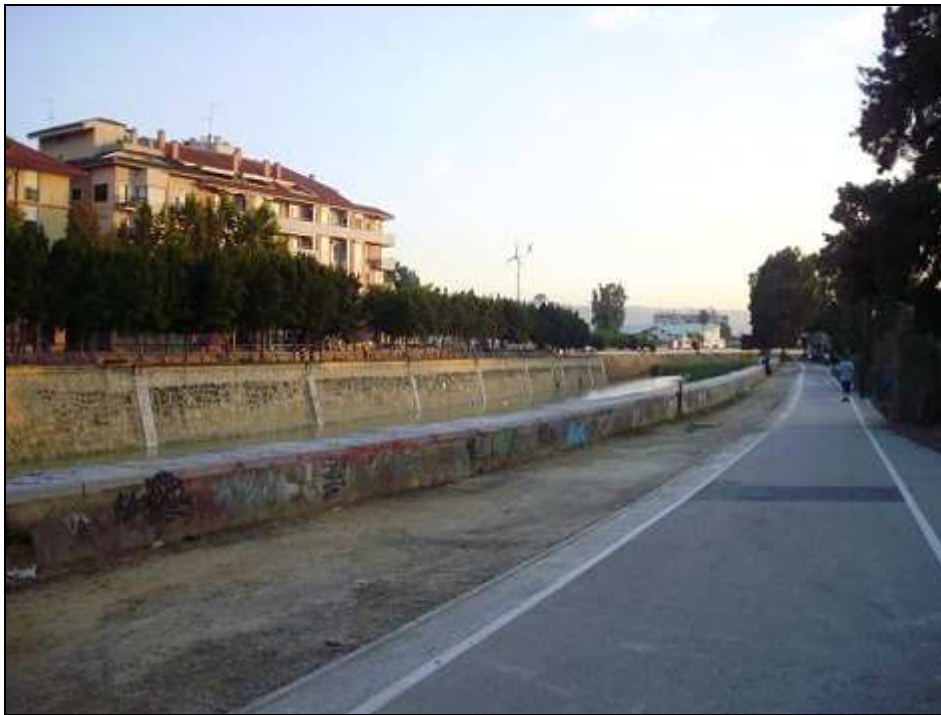
Figura 5.- Foto: Zona verde en la Ud. 2l.

Otra clase de uso del suelo es el de las zonas residenciales, aunque su correlación se de bien en todos los casos, no ofrecen una notable calidad paisajística. Así podemos ver en la siguiente imagen el de fondo una zona residencial formada por tres conjuntos de bloques, claramente discordantes en cuánto altura, color, estructura y diseño, queda justificado en que son tres edificios de tres épocas distintas pero el ordenamiento no debería de permitir esto y las nuevas construcciones tendrían que ser lo más acorde posible a las que están emplazadas ya. Hay que decir, que el incremento de variedad provoca una respuesta estética positiva, pero sólo hasta el punto en que el exceso de información produce rechazo.