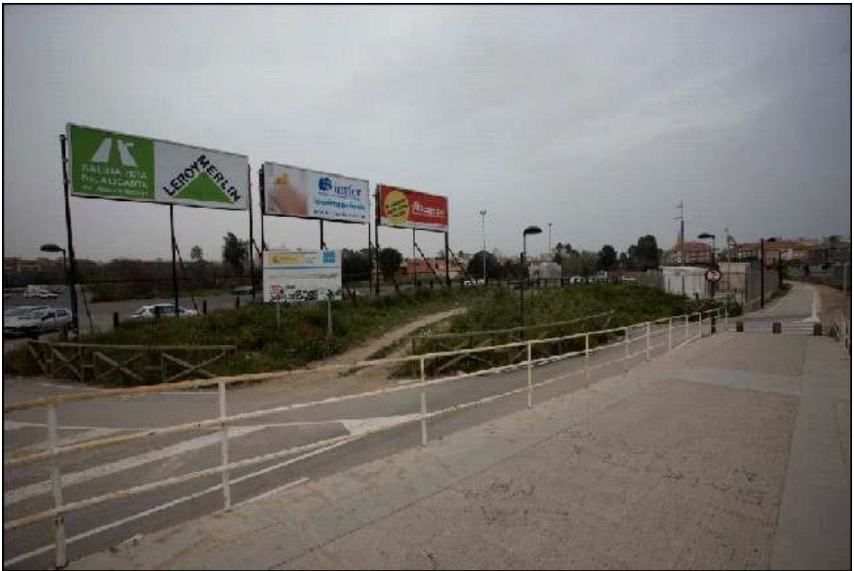
Figura 10.- Foto: Parque metropolitano equipado Ud. 11.

Aún así, también unidades con buena calidad paisajística, es el caso de la unidad 3 de la margen izquierda que presenta zona verde y ejerce bien su función, ya que es punto de encuentro y estancia de muchas personas. Presenta un grado alto de ajardinamiento, además bien cuidado, y con presencia de mobiliario, tanto de papeleras como de bancos. Bien dedicado para la estancia y paseo de personas. Presenta buena accesibilidad para personas para movilidad reducida lo que facilita el uso por toda la comunidad. Atiende a buenas razones estéticas como podemos apreciar en la imagen siguiente: