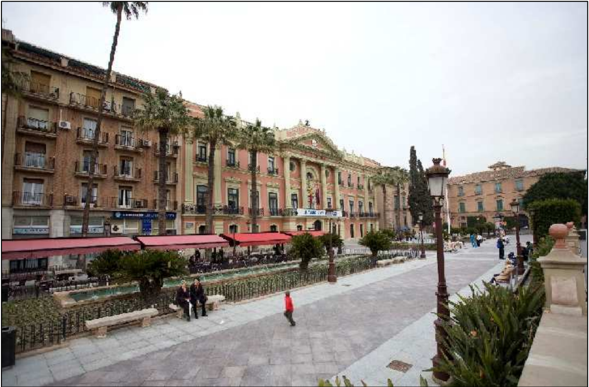
Figura 11.- Foto: Plaza de la Glorieta de Murcia. Fuente: elaboración propia.

Además en esta unidad nos encontramos con un conjunto de equipamiento estructurante, nos referimos al Ayuntamiento de Murcia, al Palacio de Almuı, Palacio Episcopal, todos ellos incluidos en el PECHA (Plan Especial del Conjunto Histrico y Artstico de Murcia). Tambin el Instituto Licenciado Francisco Cascales.