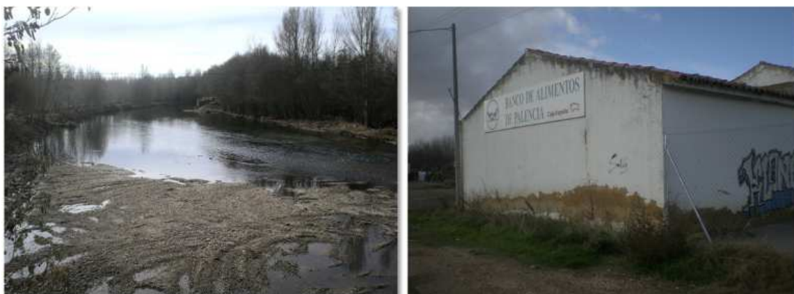
Evidencias geomorfológicas inventariadas (sedimentos fluviales/revocado en fachada)

Uno de los fundamentos básicos en el análisis de las inundaciones y del riesgo que puede conllevar su mayor o menor peligrosidad sobre un espacio determinado, lo constituye la información histórica que se tenga sobre las inundaciones acontecidas en el mismo y en su entorno inmediato.