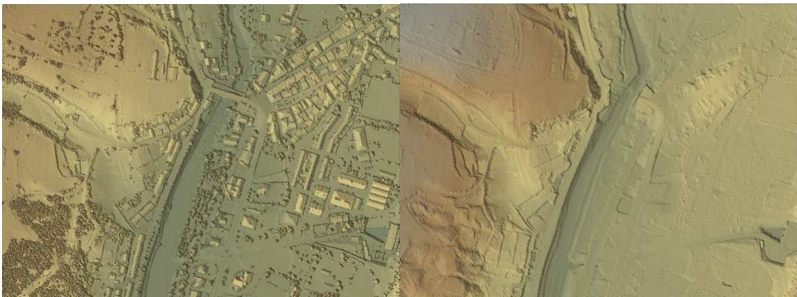
Ejemplo de productos cartográficos generados (MDE y MDT)

La nube de puntos LIDAR se ha obtenido tras realizar un vuelo de precisión y el posterior preprocesado básico de los datos. Para ello el vuelo se configuró de forma que permitiera la obtención de al menos 1 punto (retorno LIDAR) por metro cuadrado e imágenes digitales GSD de 20 cm de píxel.