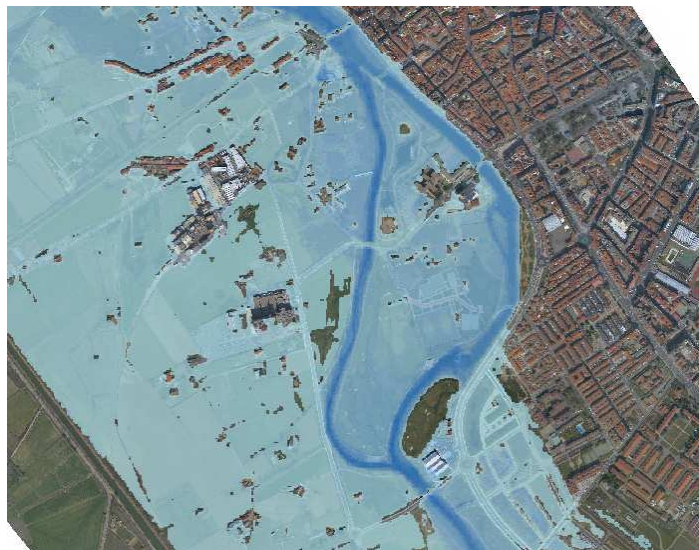
Resultado del modelo hidráulico bidimensional (ciudad de Palencia)

A modo de ejemplo, se adjunta a continuación una muestra de los resultados obtenidos con la modelización hidráulica bidimensional en el núcleo urbano de Palencia.