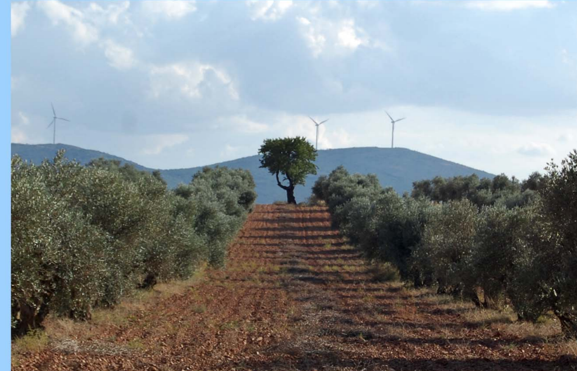
Fig.5 – Ejemplar extraordinario de almendro en un olivar del Campo de Montiel.

Las medidas de restauración de hábitats para la fauna consisten principalmente en la creación de charcas (Fig.4a) y refugios tales como majanos, muros de piedra y cajas-nido para aves insectívoras y pequeñas rapaces (Fig.4b).