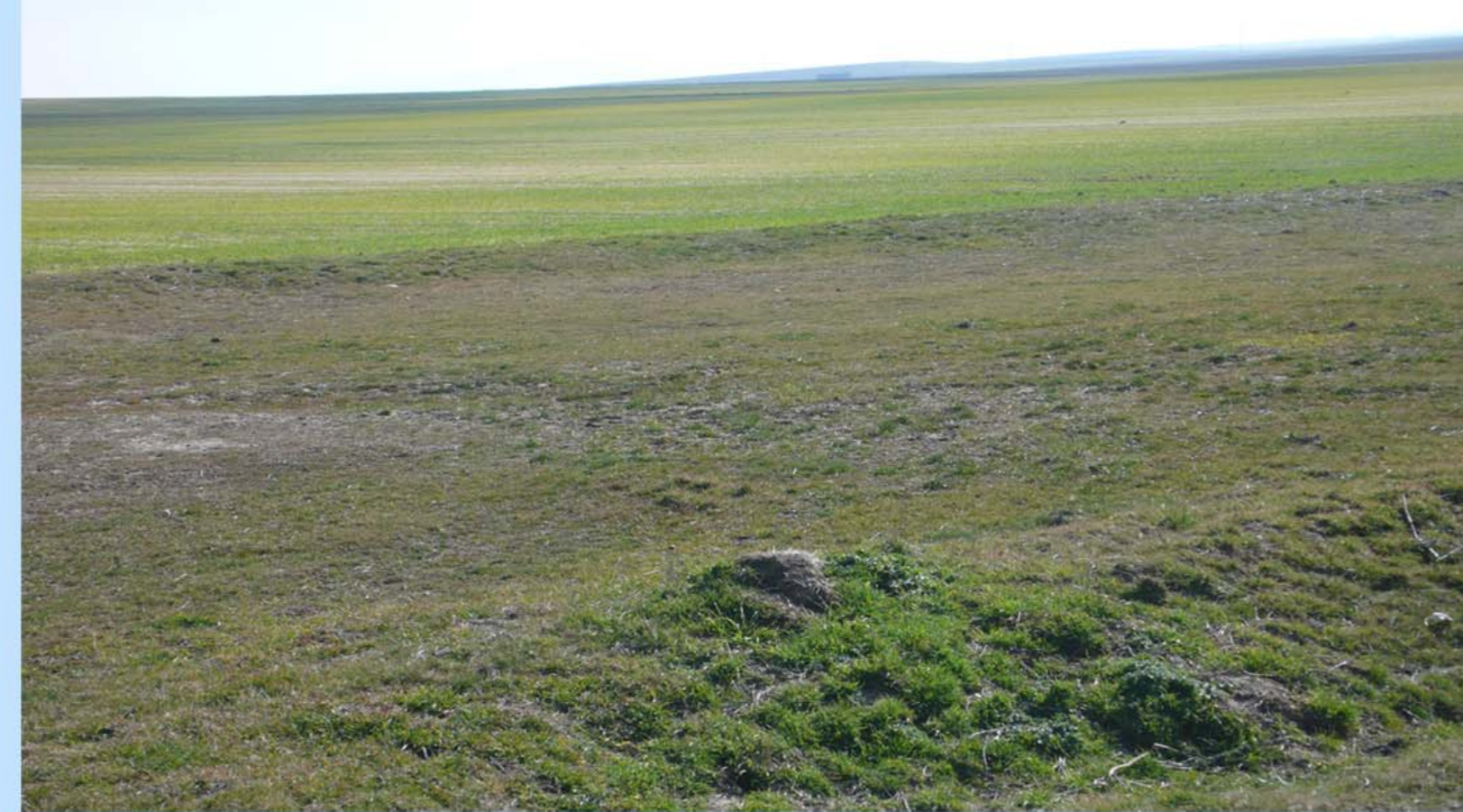
Fig.2 – Los cultivos y pastos se han expandido en detrimento de la vegetación natural, existiendo en la actualidad amplias zonas donde no existen remanentes de ésta. En la foto, un ejemplo en la provincia de Salamanca.

La iniciativa tiene como fin principal conciliar actuaciones de restauración ecológica con la utilización agrícola del territorio, es decir “renaturalizar el campo”.