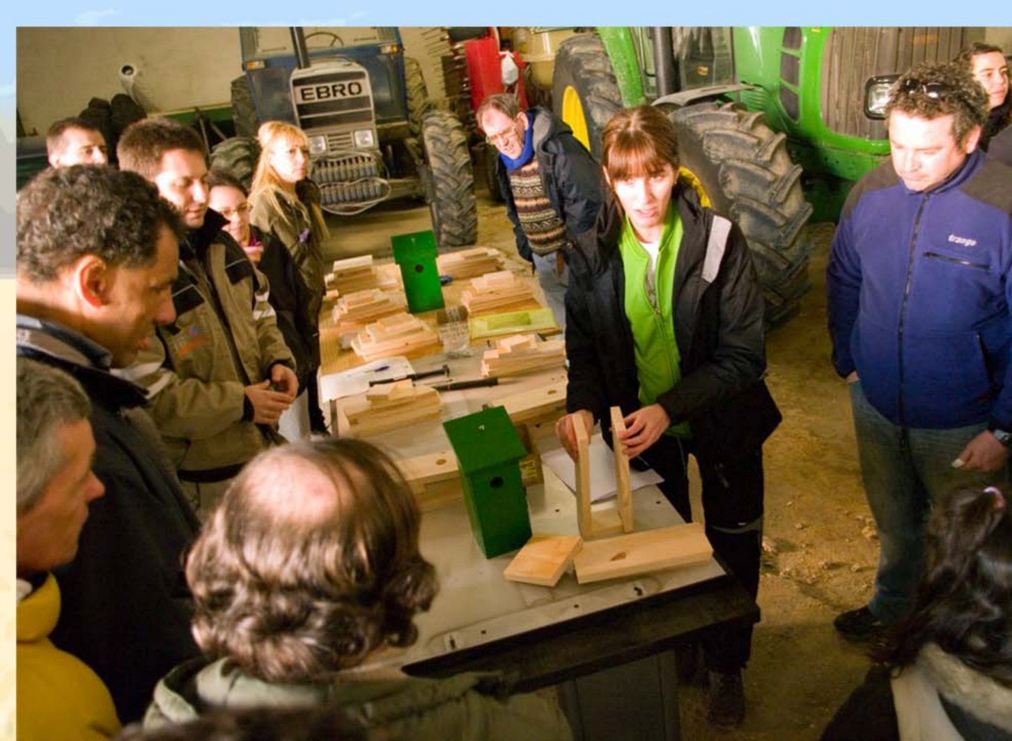
Fig.4b – Fabricación de cajas-nido para carbonero y herrero con voluntarios para su posterior instalación en los campos restaurados.

Las medidas de restauración de hábitats para la fauna consisten principalmente en la creación de charcas (Fig.4a) y refugios tales como majanos, muros de piedra y cajas-nido para aves insectívoras y pequeñas rapaces (Fig.4b).