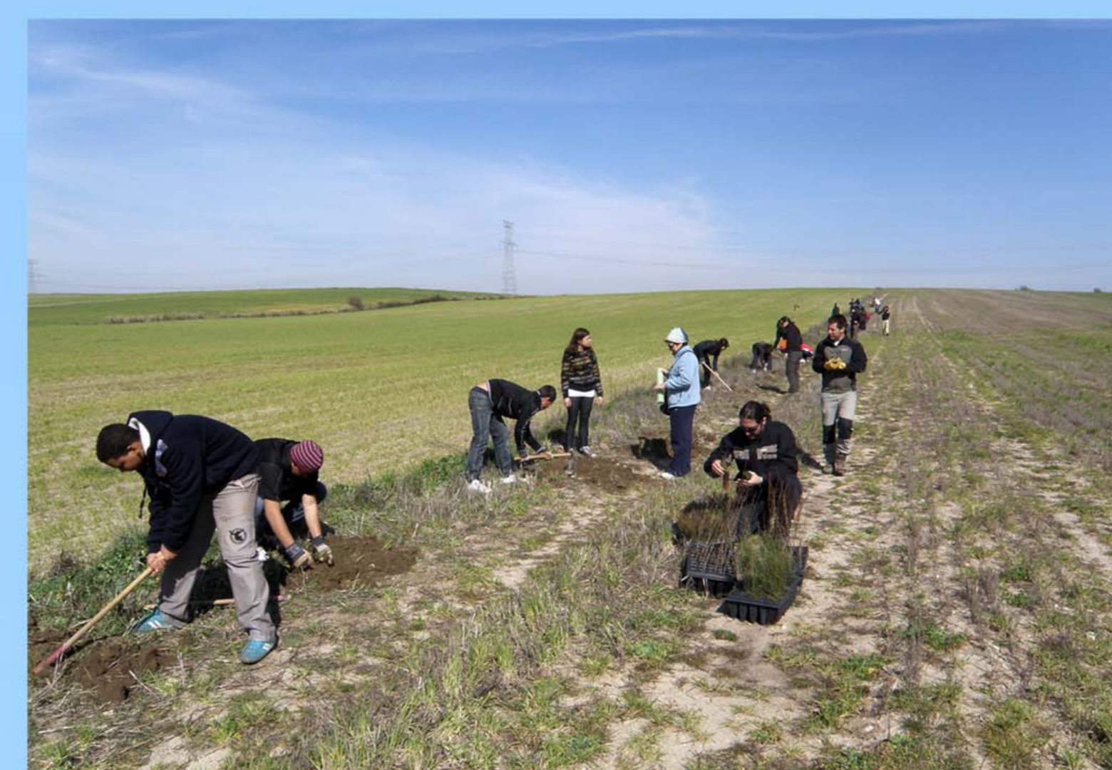
Fig.7 – Revegetación realizada mediante un voluntariado en colaboración con Acción Natura en Maqueda (Toledo).

Las actuaciones de restauración ecológica son ejecutadas principalmente por voluntarios para maximizar el rendimiento social de la Iniciativa en forma de educación y sensibilización ambiental (Fig.7).