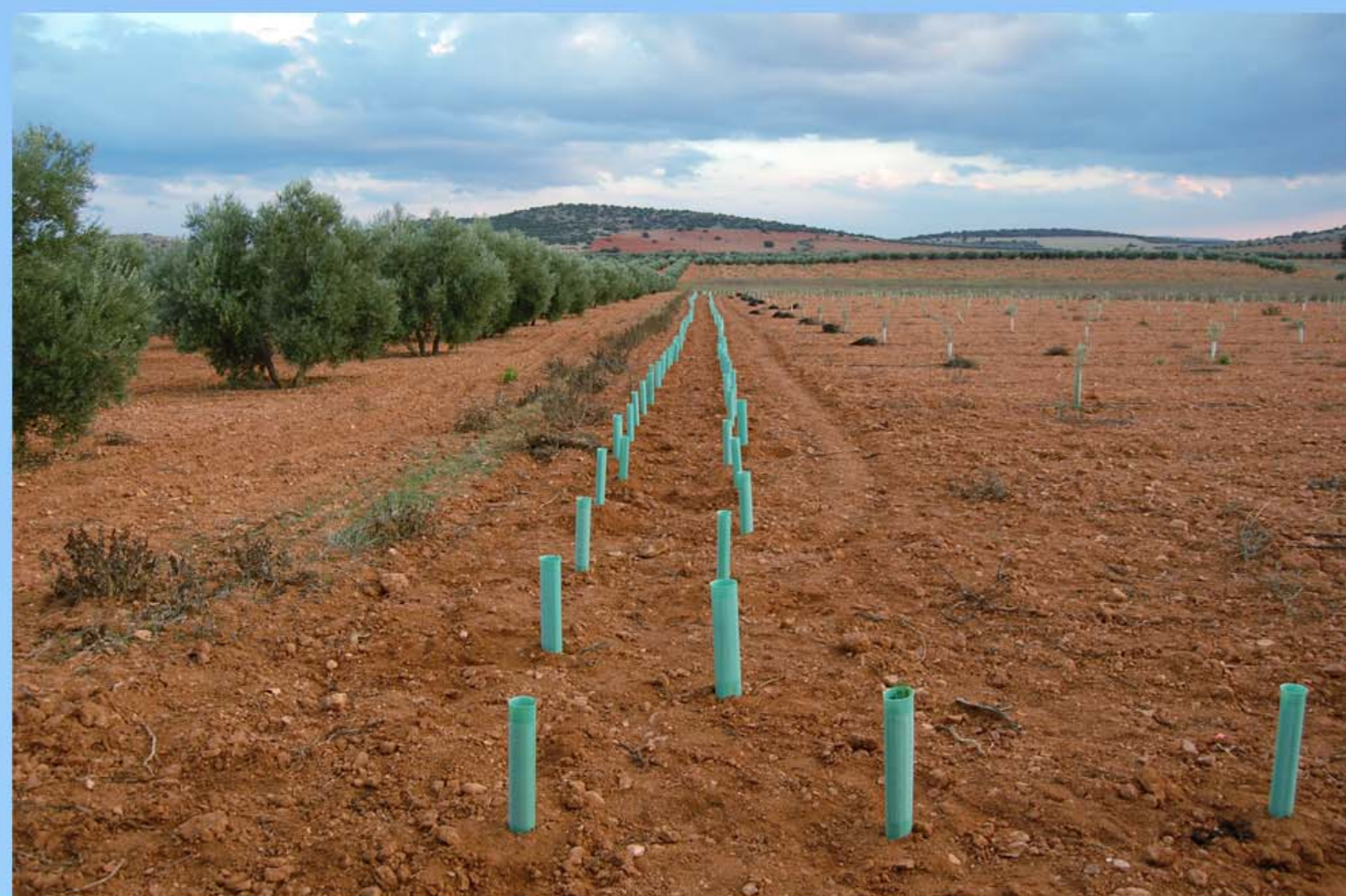
Fig.3a - Linde recientemente revegetada en un nuevo olivar ecológico en Valdepeñas (Ciudad Real).

Las actuaciones programadas implican sobre todo la revegetación de bordes de camino, lindes y ribazos (las “costas”, Fig.3a) y la introducción de parches de vegetación leñosa densa (los “islotes”, Fig.3b) con especies arbóreas y arbustivas nativas en paisajes muy deforestados (los “mares”).