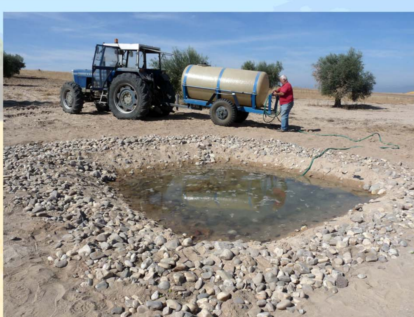
Fig.4a – Creación de una charca con la participación de voluntarios.

Además de las revegetaciones, se realizan otras actuaciones de restauración relacionadas con la mejora y creación de hábitats para la fauna y la conservación de variedades tradicionales de frutales.