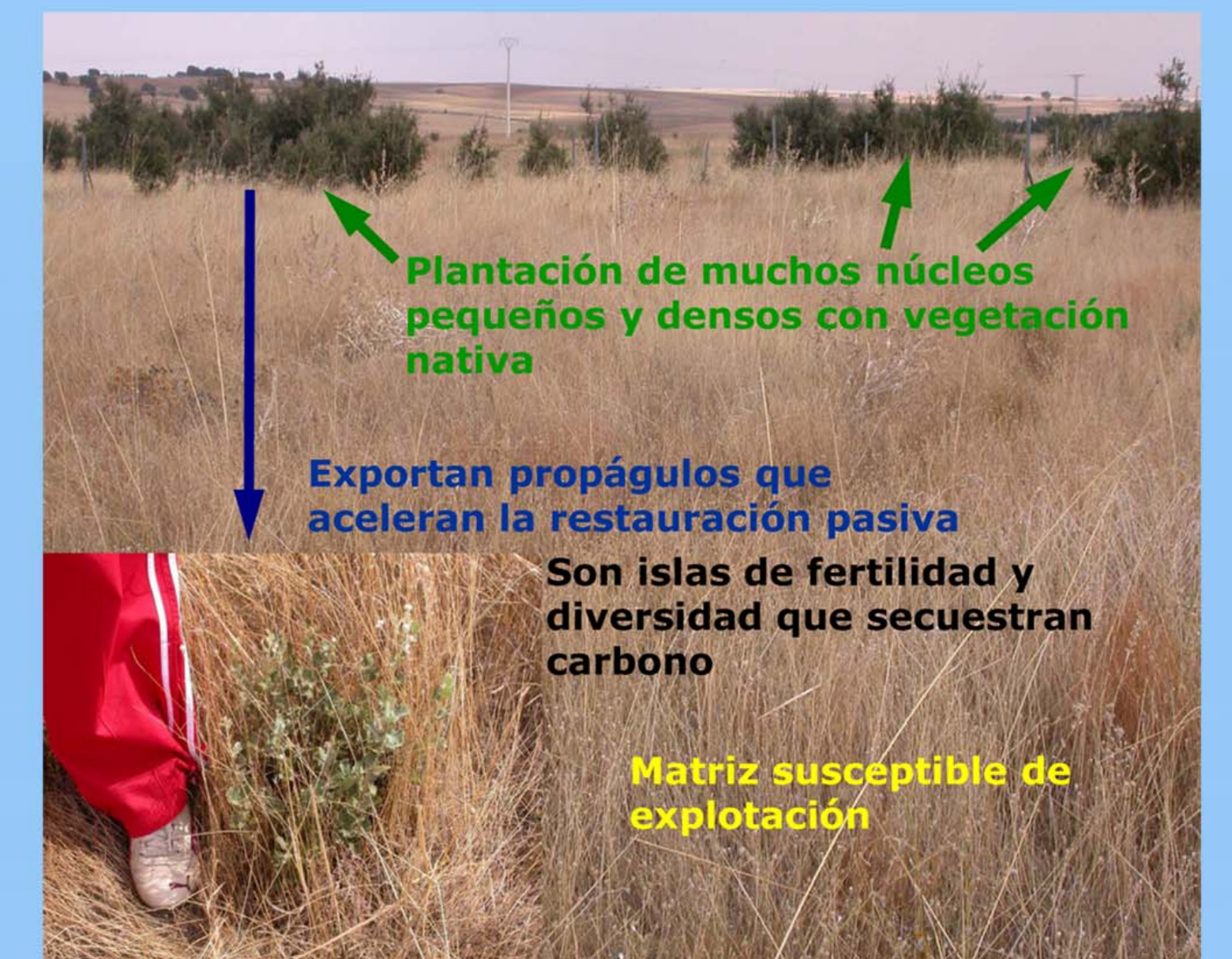
Fig. 6 – Fotografía de un campo experimental con islotes de encinas y esquema de las ideas clave.

Proporcionan las semillas necesarias para la revegetación pasiva de los campos abandonados próximos (Fig. 6).