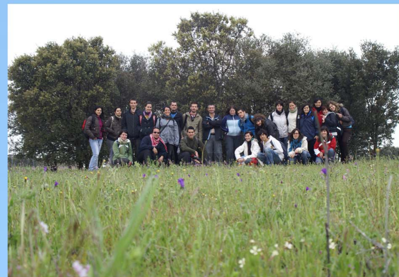
Fig.3b – Islote forestal de encinas en una tierra agrícola después de 17 años de crecimiento.

Todas las actuaciones son realizadas en fincas agrícolas con acuerdos de custodia (la FIRE tiene firmados 11 acuerdos de custodia recogidos en el 2º Inventario de Iniciativas de Custodia del Territorio de la Fundación Biodiversidad) y discutidas in situ con los propietarios de las mismas. Los propietarios proporcionan un nombre propio a su Campo de Vida.