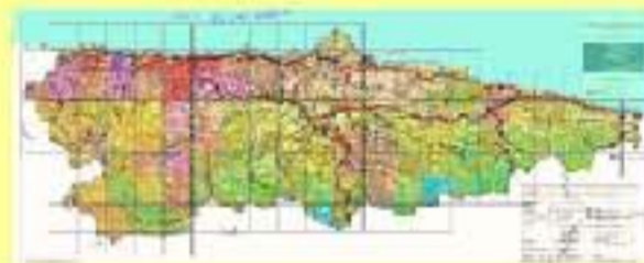
MAPA DE LA SUPERFICIE DE RESIDUOS ACCESIBLES