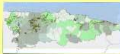
MAPA DE RESIDUOS TOTALES