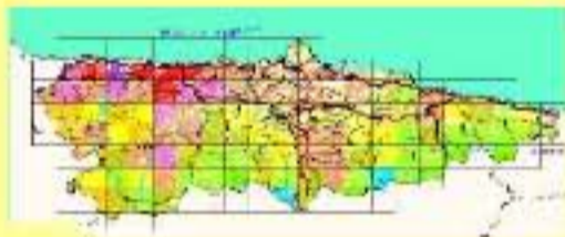
MAPA VIALES FORESTALES