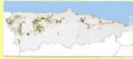
MAPA DE SUPERFICIE OCUPADA