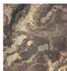
Fig. 5. Imagen 5.3 georreferenciada

Ejemplo medición de longitud de caminos (Figs. 5 y 6):