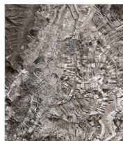
Fig. 9. Entorno de Tamajón (1956). Escala 1:12024