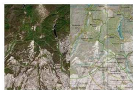
Fig.3. Situación del área de estudio.