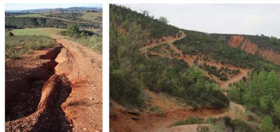
Figs. 1 y 2. Los caminos situados sobre afloramientos de rocas poco resistentes a la erosión y en pendientes pronunciadas.

Los geoindicadores son medidas (magnitudes, frecuencias, tasas y/o tendencias) de fenómenos y procesos geológicos que ocurren cerca de o en la superficie terrestre, y que están sujetos a variaciones lo suficientemente significativas como para comprender cambios ambientales producidos a escala temporal humana (Berger e Iams, eds., 1996). En zonas con relieves pronunciados y en las que afloran materiales poco resistentes a la erosión (Figs. 1 y 2), tanto los caminos como los campos de cultivo que se abandonan, son un foco muy importante de pérdida de suelo. Analizando la evolución de la longitud total de los caminos y de la superficie cultivada, en un ámbito geográfico concreto, se puede conocer cómo han cambiado a lo largo del tiempo la pérdida de suelo asociada a estos factores.