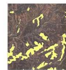
Fig. 8. Imagen 5.4 digitalizada