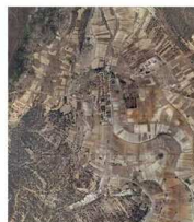
Fig. 10. Entorno de Tamajón (2006-2008). Escala 1:12466