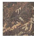
Fig. 7. Imagen 5.4 georreferenciada

Ejemplo medición del área cultivada (Figs. 7 y 8):