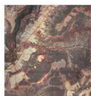
Fig. 6. Imagen 5.3 digitalizada

Ejemplo medición del área cultivada (Figs. 7 y 8):