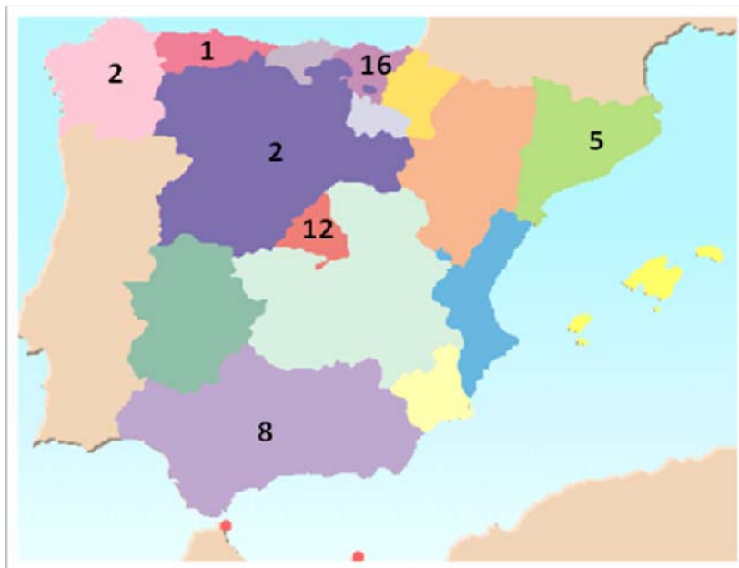
Distribución por Comunidades Autónomas de las entidades de inspección acreditadas en el ámbito de suelos.

Como consecuencia de estos cambios legislativos, el incremento de Entidades de Inspección Medioambiental en el ámbito de Suelos en los últimos años ha sido considerable. En la actualidad hay 46 entidades de inspección acreditadas en este ámbito, siendo las Comunidades Autónomas del País Vasco y Madrid las que cuentan con el mayor número de entidades acreditadas. Algunas de estas entidades disponen de delegaciones acreditadas en diferentes Comunidades, lo que incrementa considerablemente el número de unidades técnicas objeto de evaluación por parte de ENAC.